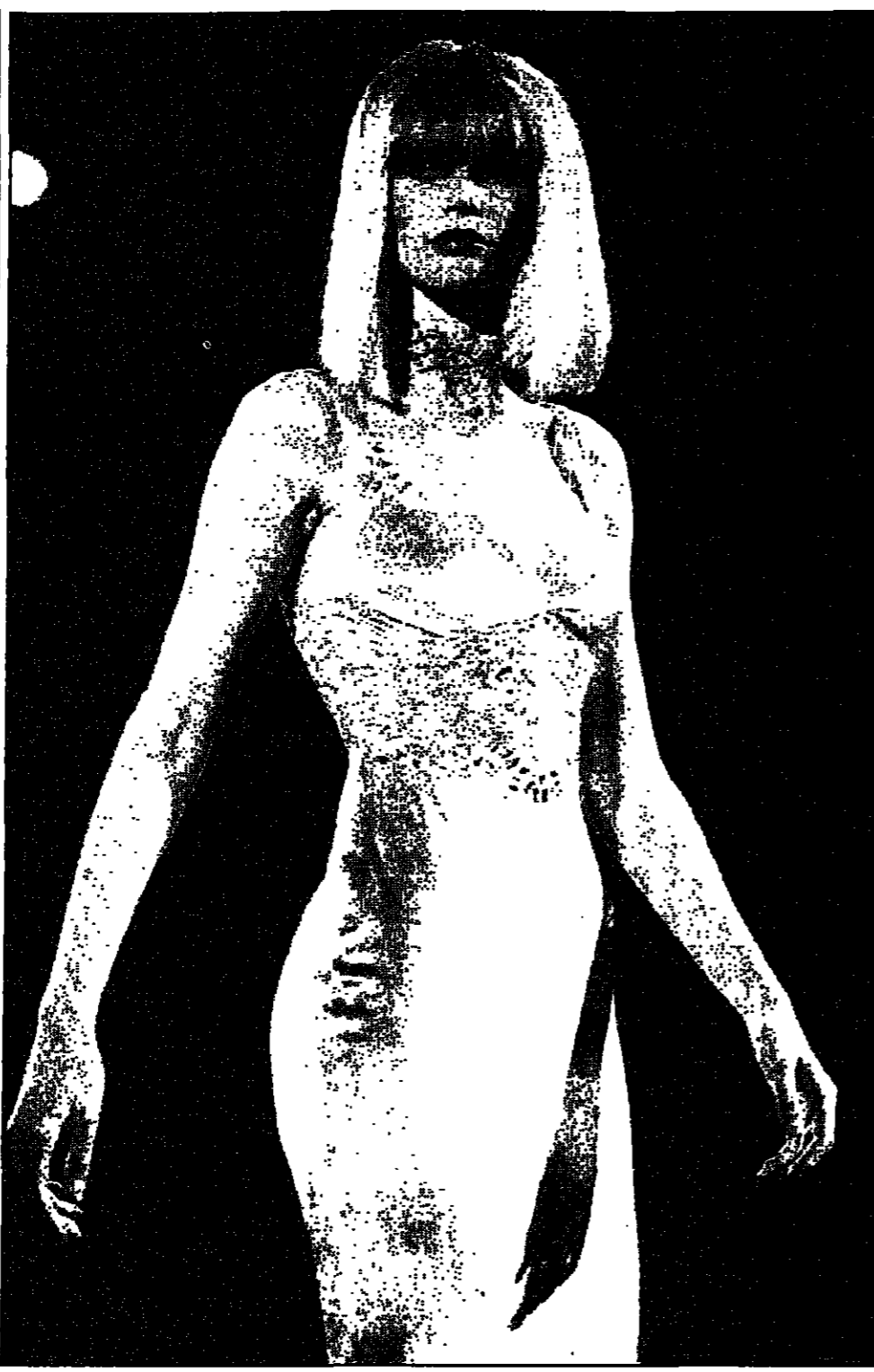
عارضة الأزياء كلوديا شيفر. تقدم آخر مميزات الموسم. فستان سبعة عباة عن نسخة من الملابس الداخلية.

تروبي - أفيد في نشرته الصحفية القضاة أن القضاة في البلاد متقسمون حول وضع الشعر السطير وأثناء التظاهرة القضاة في بريطانيا وهو تقليد موروث عن الفترة الاستعمارية البريطانية. وفي دولة عنت في مومباسا على الساحل الكيني، قال أحد القضاة الشيخ أمين، ماذا يتوجب علينا الاستمرار في حمل الشعر السطير كما يفعل زملائنا البريطانيون.